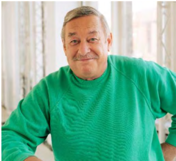
Abbildung 2: Christoph Biemann