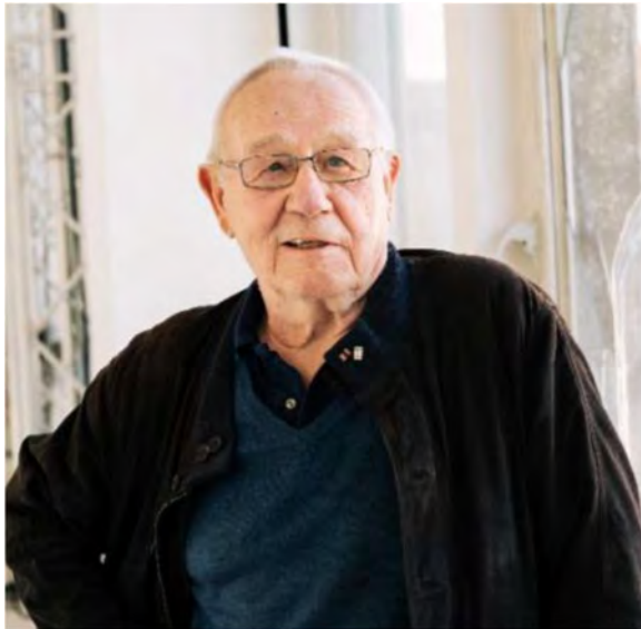
Abbildung 1: Armin Maiwald